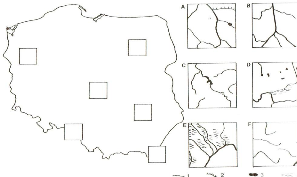
1 – rzeki, 2 – kanały, 3 – jeziora, 4 – bagna